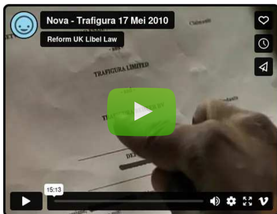
Vimeo | Trafiguros vairuotojai: „Mus papirko“

“ Vimeo komentatorius: „Ačiū, kas bebūtum, kad tai padarei prieinamą. Kaip žinai, čia JK mums neleidžiama nei skaityti, nei matyti nieko iš šio.“